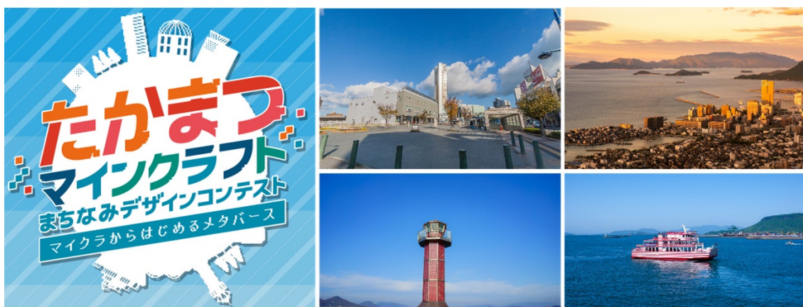
▲右：コンテストロゴ 左：モデルとなった高松市の名所

親しみやすさを感じてもらえるように、上段にサンポートエリア・下段に瀬戸内海をモデルにしています。こちらのロゴは、特設サイトをはじめ、ポスターやチラシのほか、幅広く使用されています。