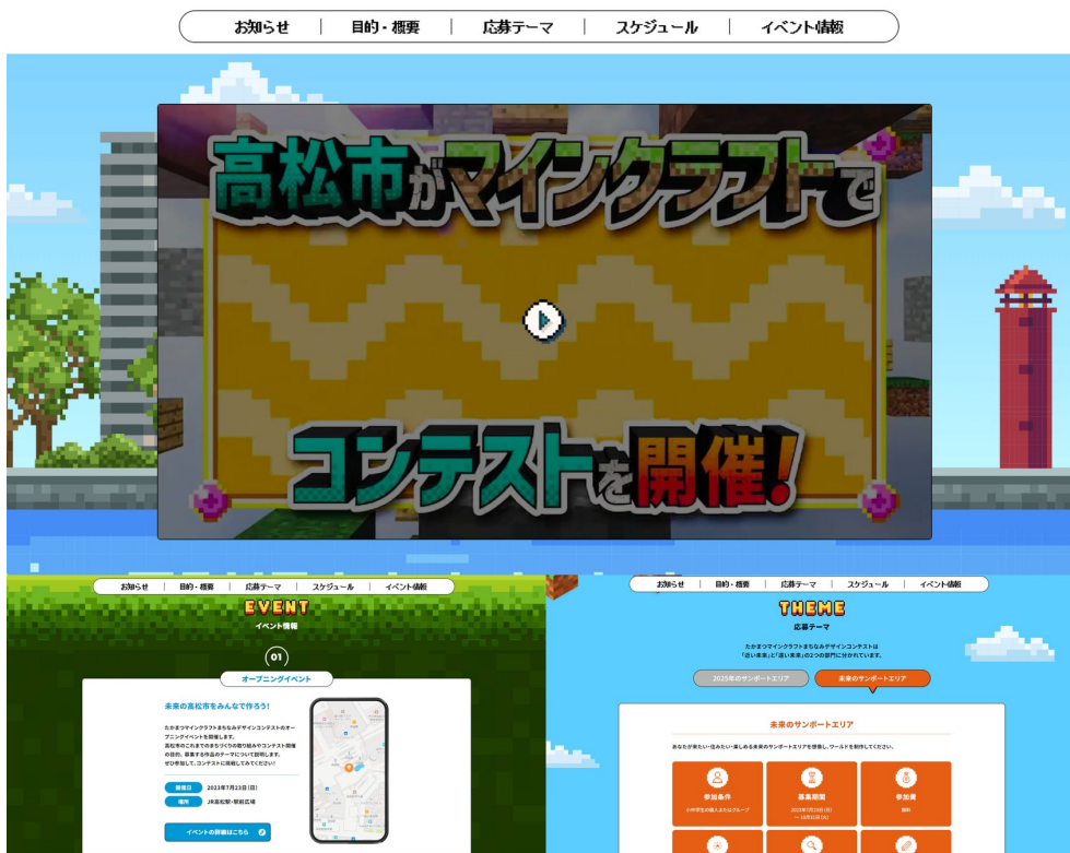
▲街並みを踏襲したゲーム風に再現した特設サイトのデザイン

高松市の街並みを取り込みながら、ゲームを想起させるデザインを起用し、見ているだけでワクワクするようなサイトを目指しました。